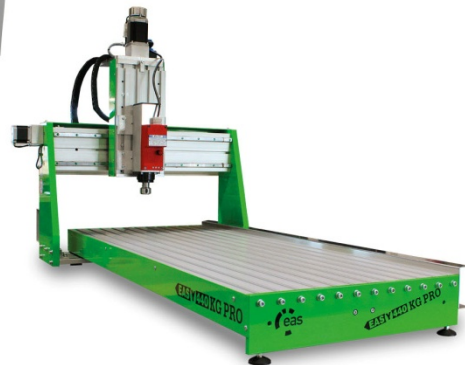
EAS(Y) 440 KG PRO