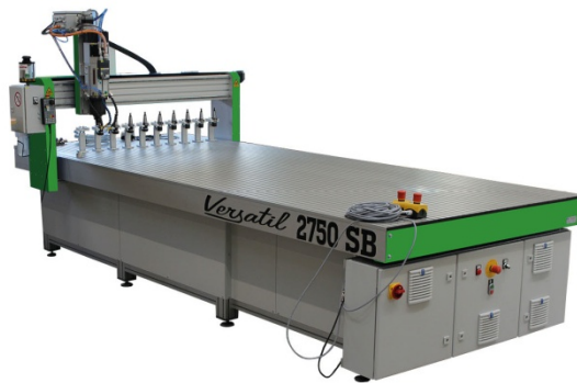
Versatil 2500 SB